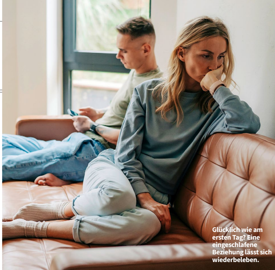
Glücklich wie am ersten Tag? Eine eingeschlafene Beziehung lässt sich wiederbeleben.

Sind die Schmetterlinge erst mal verflogen und hat sich der Alltag in eine Beziehung geschlichen, ist Arbeit angesagt. Arbeit, die sich lohnt. Ein Paartherapeut verrät seine besten Tipps.